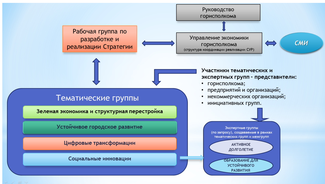
Рисунок 11 - Структура управления реализацией СУР–2035

Тематические и экспертные группы осуществляют инициирование, разработку, мониторинг реализации и оценку проектов для достижения целей СУР–2035. В состав тематических и экспертных групп входят представители бизнеса, общественности, местных органов власти, представителей ключевых структурных подразделений Бобруйского горисполкома.