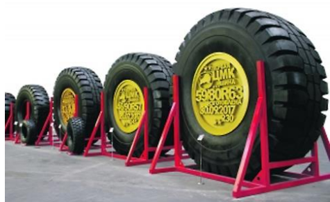
Рисунок 5 - Продукция ОАО «Белшина»

Химическая и нефтехимическая промышленность. ОАО «Белшина» — один из крупнейших производителей в шинной отрасли. Широкий ассортимент шин — более 300 типоразмеров — шины для легковых, грузовых, большегрузных автомобилей, строительно-дорожных и подъемно-транспортных машин, электротранспорта, автобусов, тракторов и сельскохозяйственных машин. Дистрибьюторская сеть компании предлагает шины потребителям в более чем 70 странах мира.