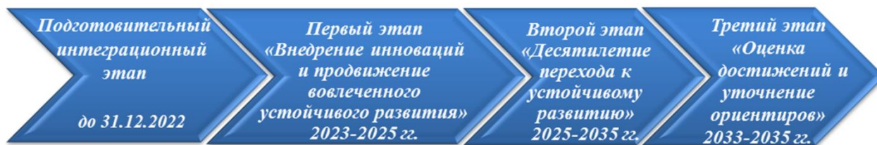
Рисунок 9 - Этапы реализации СУР города Бобруйска

Достижение устойчивого развития города Бобруйска – сложный и долговременный процесс, включающий ряд последовательно реализуемых этапов, представленных на рисунке 9.