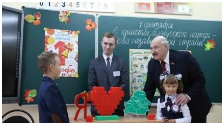
Рисунок 6 – Открытие школы № 35 города Бобруйска

Сеть учреждений образования города включает 34 учреждения общего среднего образования (в их числе 3 гимназии, гимназия-колледж искусств), 3 центра дополнительного образования детей и молодежи, центр коррекционно-развивающего обучения и реабилитации, 61 учреждение дошкольного образования, 2 учреждения профессионально-технического образования, 7 учреждений среднего специального образования. Функционируют 2 социально-педагогических центра, 8 детских домов семейного типа. В Бобруйске развита инфраструктура для полноценного развития молодежи (рисунок 6).