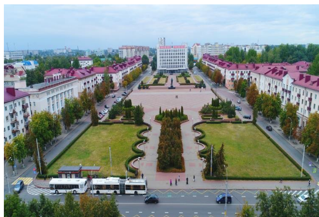
Рисунок 2 – Панорамный вид центра города Бобруйска

Бобруйск развивает торгово-экономические отношения более чем с 70 странами мира. При этом помимо традиционных торговых партнеров (ЕАЭС) происходит расширение внешнеэкономических связей со странами «дальней дуги» практически всех регионов земного шара. Главными экспортными позициями является продукция нефтехимического комплекса, деревообработки, легкой и пищевой промышленности, а также сельскохозяйственная техника. Основные задачи в развитии внешней торговли связаны с переориентацией рынков сбыта продукции на альтернативные, в том числе в условиях санкционных ограничений.