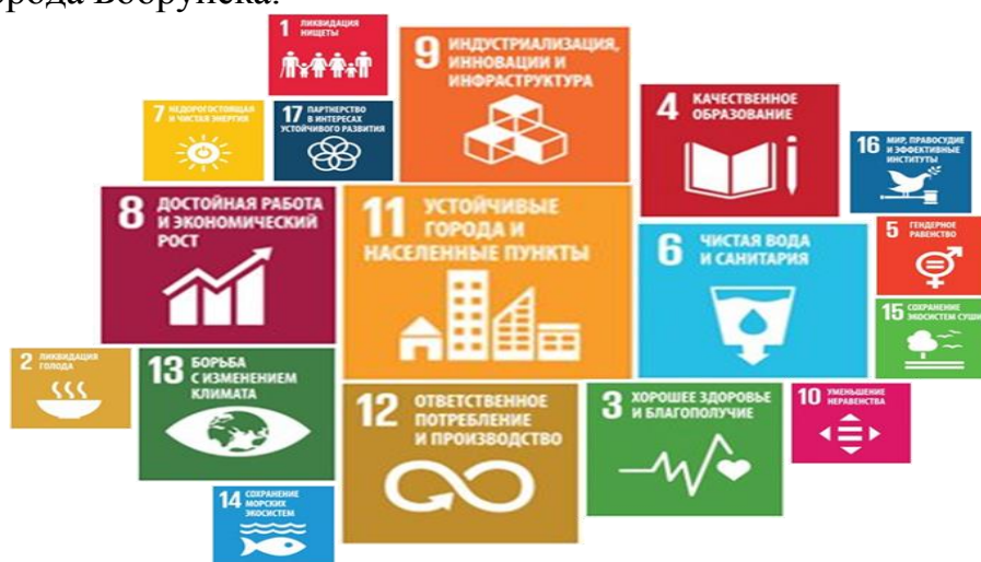
Рисунок 1 - Матрица ЦУР (размер логотипов ЦУР указывает на степень значимости для развития города: больше размер логотипа – выше значимость ЦУР)

На рисунке 1 представлена матрица ЦУР с учетом их значимости для развития города Бобруйска.