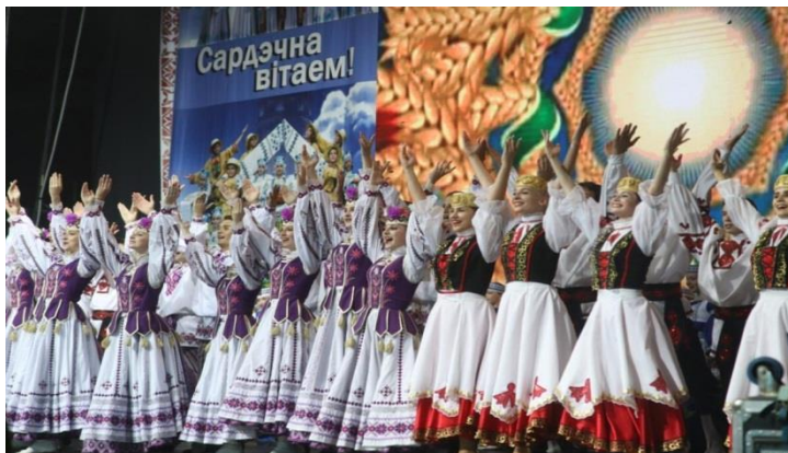
Рисунок 7 - Международный фестиваль народного творчества «Венок дружбы»

использование цифровых коммуникационных технологий, в том числе для обеспечения доступа граждан к культурным ценностям независимо от места проживания.