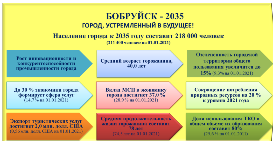
Рисунок 8 - Ключевые индикаторы желаемого видения развития города Бобруйска

Ключевые индикаторы желаемого видения развития города Бобруйска к 2035 году представлены на рисунке 8.