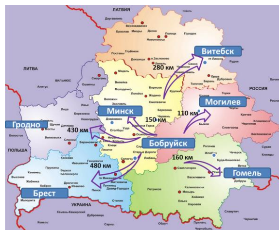
Рисунок 3 - Географическое положение города Бобруйска

Территориально город Бобруйск разделен на 2 района: Ленинский и Первомайский. Управление городским развитием осуществляет Бобруйский городской исполнительный комитет, который взаимодействует с администрациями Ленинского и Первомайского районов г. Бобруйска.