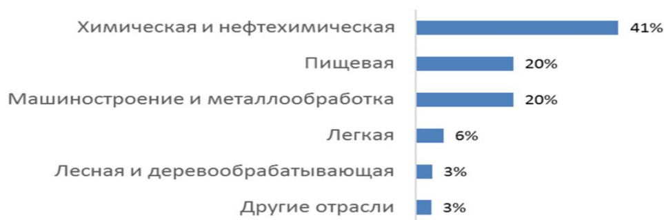
Рисунок 4 - Удельный вес важнейших отраслей в структуре промышленности Бобруйска (2020 год)

Свыше 65 процентов всей производимой в городе продукции поставляется на экспорт, товарная номенклатура которого насчитывает свыше 300 позиций продукции.